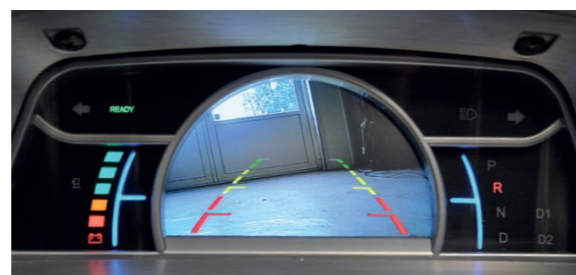
Displayet fungerer både som speedometer og bakkamera.