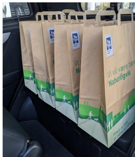
Rummeligt bagsæde med sikkerhedssele, som er godkendt til 1 passager, ligesom der også er god plads til bagage, indkøbsposer el.lign.